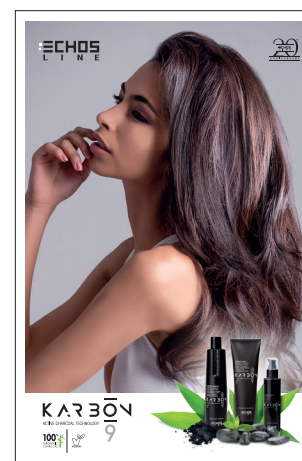
CARTELLO VETRINA Pancard 63 x 94 cm cod. 8023819