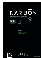
TREATMENTS LEAFLET 20 pag. – 14,8 x 21 cm cod. 8023852