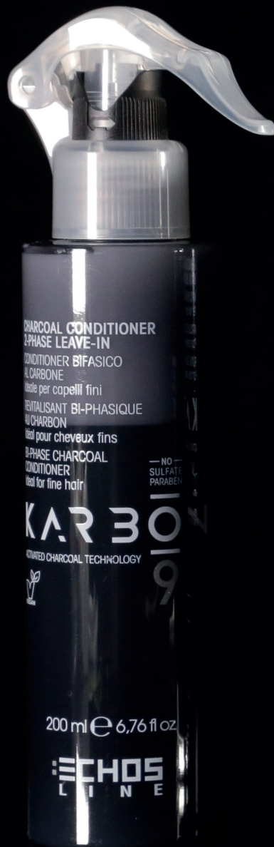
CHARCOAL CONDITIONER 2-PHASE LEAVE-IN