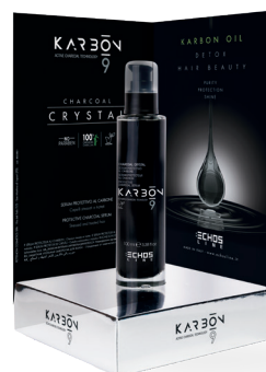
EXPO CHARCOAL CRYSTAL cod. 8023821