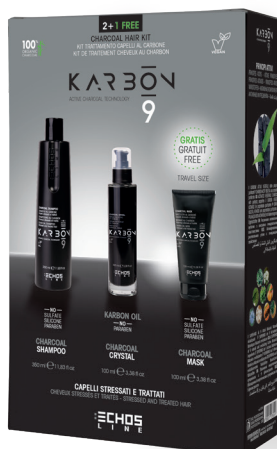
CHARCOAL HAIR KIT 2 + 1 FREE Charcoal Shampoo 350 ml Charcoal Crystal 100 ml Charcoal Mask 100 ml cod. 1023824