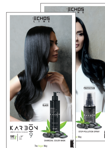
TOTEM DA BANCO Desk totem 20 x 40 cm cod. 8023846