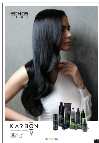
TREATMENTS POSTER 70 x 100 cm cod. 8023844